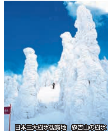
日本三大樹氷観賞地 森吉山の樹氷