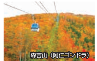
森吉山(阿仁ゴンドラ)