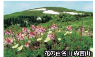
花の百名山 森吉山